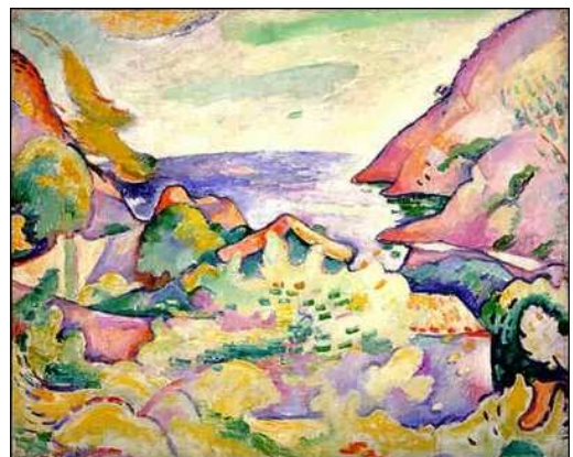
La Calanque de La Ciotat, Braque