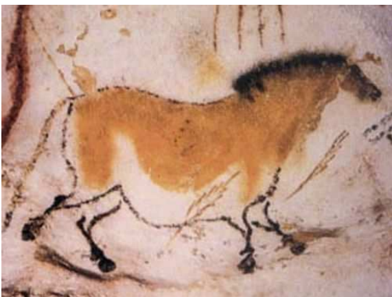
Grotte préhistorique Cosquer

4 professeurs (histoire-géographie/Histoire des arts, SVT, Physique-Chimie, Italien) apportent un éclairage complémentaire sur l'objet patrimonial que représentent les Calanques.